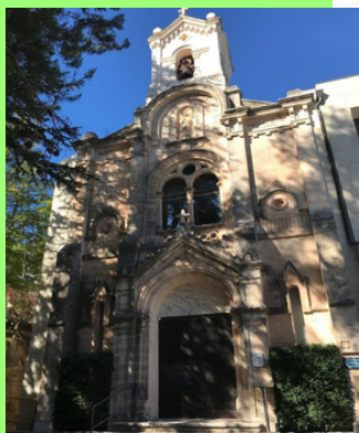
Actual Iglesia de la Font Roja, 1891

Resulta muy curioso comprobar junto a la fachada de la ermita, unos azulejos que marcan la altura de 2,10 metros que alcanzó la nieve el 27 diciembre de 1926, tras tres intensos días de lo que se denominó la Gran Nevada.