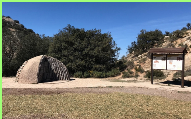
Recreación de una carbonera en el Pla de la Mina

Ya fuera del Barranc de l'Infern, podemos coger la pista forestal que sigue a la derecha para llegar a la cumbre del Menejador, que con 1.354 metros de altura el pico más alto del parque.